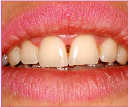
Recuperación de papilas y labios con odontología biológica.

Instruimos al alumno en el manejo de las vías aéreas superiores (ronquido-apnea del sueño) mediante activación parasimpática, de vital importancia en Odontología Biológica. Mostramos los protocolos de retorno a la salud periodontal y de recuperación de las papilas con métodos biológicos.